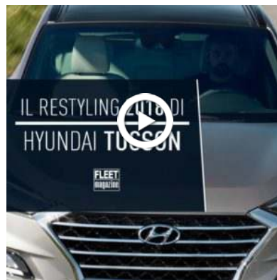
Il Restyling 2018 di Hyundai Tucson